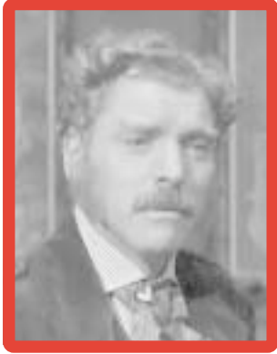
Principe Fabrizio di Salina

EXPLICAR que papel desempeña cada uno y las relaciones que se establecen entre ellos.